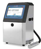
小字符喷码机系列