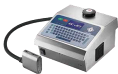
DOD大字符喷码机系列