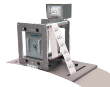
TTO热转印打印机系列