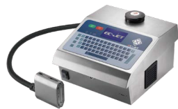
DOD大字符喷码机系列