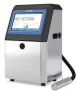
小字符喷码机系列