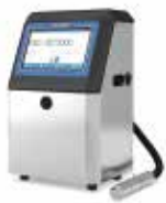
小字符喷码机系列