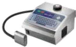
DOD大字符喷码机系列