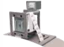
TTO热转印打印机系列