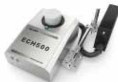
高解析喷码机系列