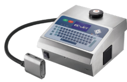
DOD大字符喷码机系列