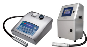
小字符喷码机系列