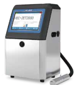
小字符喷码机系列