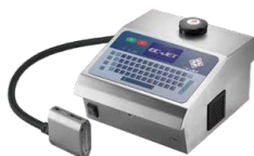
DOD大字符喷码机系列